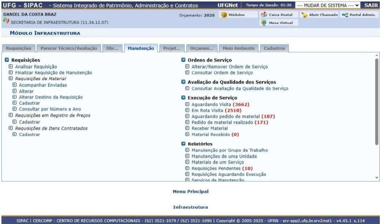
Figura 1: print screen da tela do módulo Infraestrutura do SIPAC em 29/08/2025.

As quantidades estimadas foram definidas com base nas requisições registradas no sistema SIPAC no exercício anterior. Para 2024 foram identificadas cerca de 6.450 requisições de atendimento. Para 2025, projeta-se quantitativo equivalente ou superior, considerando o histórico de consumo e a manutenção preventiva e corretiva necessária.